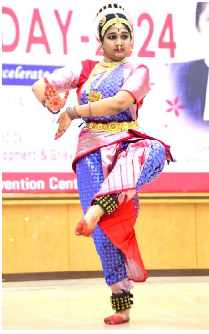
(మొదటి పేజీ నుంచి)