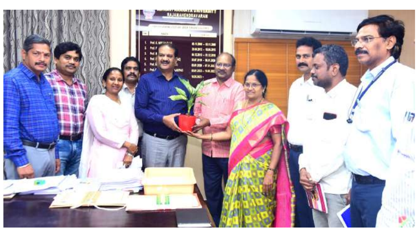
ఉమ్మడి గోదావరి జిల్లాల డీకావోలు మరియు సర్వ శిక్ష అభియాన్ అధికారులు